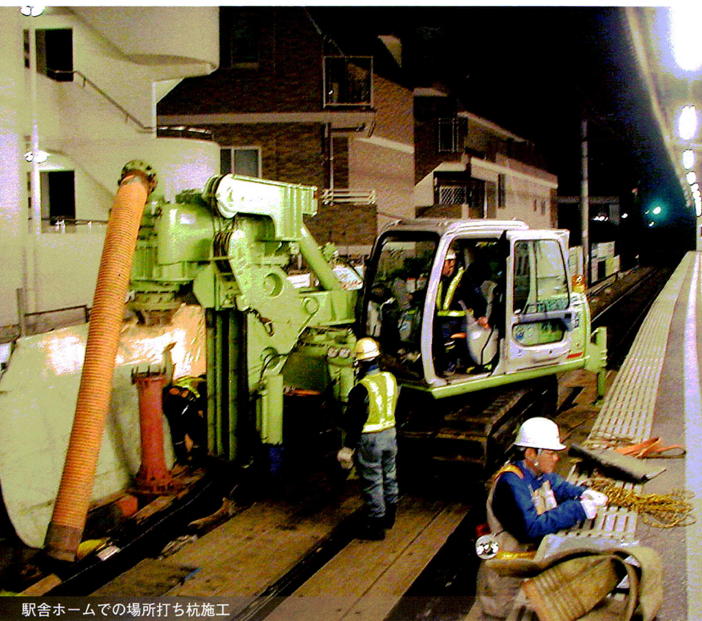
駅舎ホームでの場所打ち杭施工