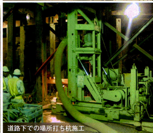
道路下での場所打ち杭施工

リバース工法の1つであるTBH工法は、トップドライブ式の掘削機を使用します。従来施工が不可能であった狭い場所、空頭に制限がある場所においても大深度・大口径の掘削を可能にした工法です。